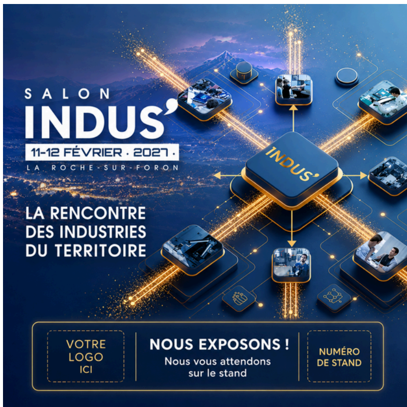
Visuel à personnaliser - format carré