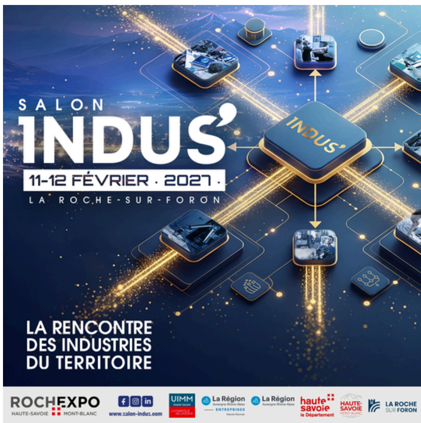
Format Instagram 1080x1080px