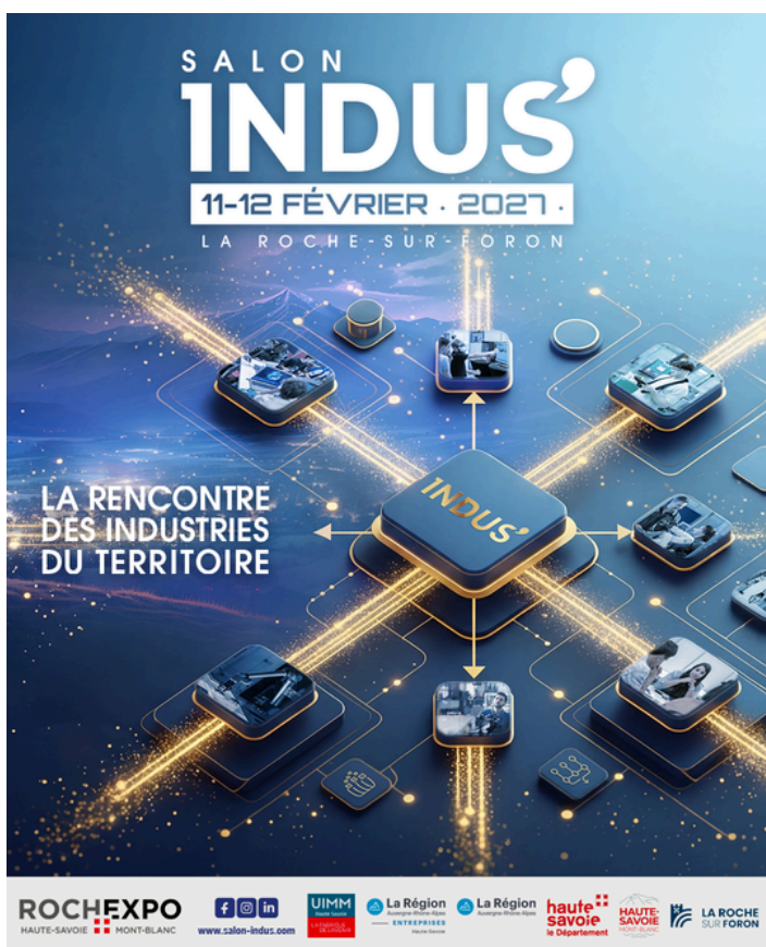
Format Instagram 1080x1350px