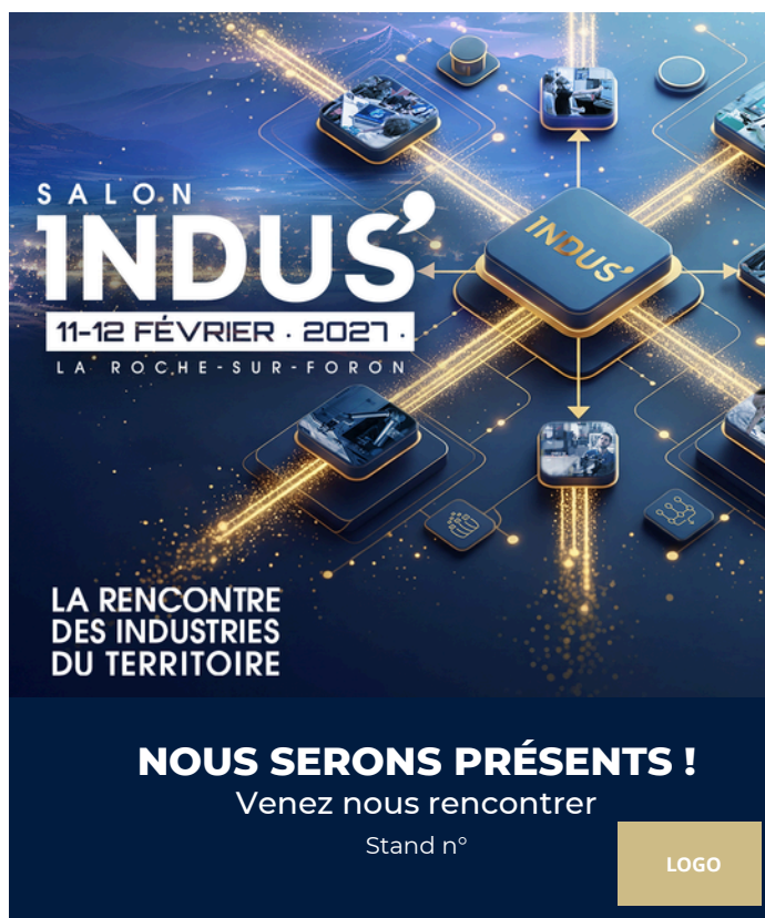
Visuel à personnaliser - réseaux sociaux