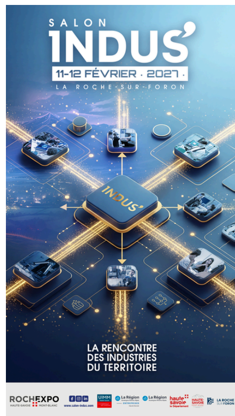
Format story 1080x1920px